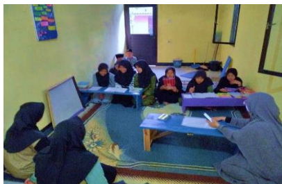
Gambar 6 Kegiatan pembelajaran interaktif yang Diterapkan Oleh Mahasiswa

Sebagai bagian dari upaya untuk meningkatkan keterlibatan anak-anak dalam pembelajaran agama, mahasiswa KKN mengadakan lomba hafalan doa-doa dan ayat-ayat Al-Qur'an. Lomba ini tidak hanya mendorong anak-anak untuk lebih giat belajar, tetapi juga memberikan mereka kesempatan untuk menunjukkan kemampuan mereka di depan teman-teman mereka, yang pada gilirannya meningkatkan rasa percaya diri.