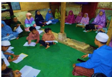
Gambar 2 Mahasiswa memandu anak- dalam sesi pengajian

Salah satu metode yang digunakan adalah Nadzom, yaitu teknik hafalan yang diiringi dengan irama yang menyenangkan, yang terbukti mampu menarik minat anak-anak untuk lebih fokus dan antusias dalam menghafal. Setiap sesi pengajian diakhiri dengan sesi tanya jawab, di mana anak-anak yang mampu menjawab pertanyaan dengan benar diberikan hadiah atau reward. Pemberian reward ini berfungsi sebagai motivasi tambahan bagi anak-anak agar mereka lebih aktif dalam mengikuti pengajian. Melalui pendekatan ini, mahasiswa KKN berhasil menciptakan suasana belajar yang lebih dinamis dan interaktif.