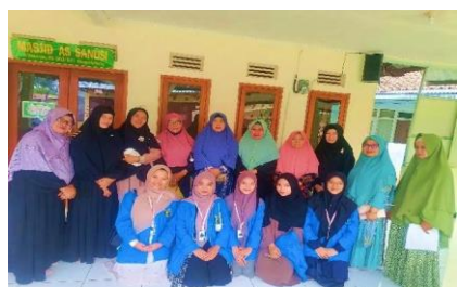
Gambar 4 Ibu-ibu berpartisipasi aktif dalam kegiatan pengajian