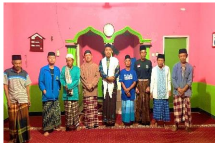
Gambar 5 Pelatihan guru ngaji oleh mahasiswa

lebih peka terhadap kebutuhan peserta pengajian dan menciptakan suasana kelas yang lebih kondusif.