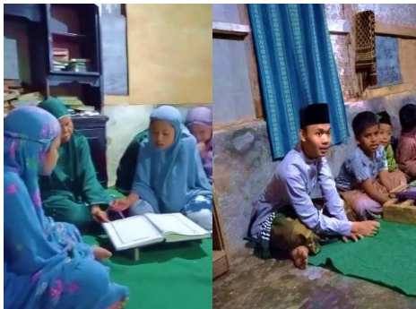
Gambar 7 Pendekatan Personal dan Evaluasi Rutin dalam Pembelajaran Agama

metode pembelajaran agar program pengabdian masyarakat dapat berjalan lebih efektif dan memberikan dampak yang berkelanjutan.