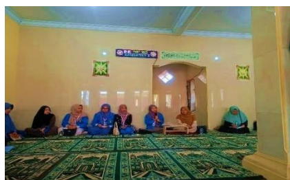
Gambar 3 Ibu-Ibu berpartisipasi aktif dalam kegiatan pengajian

Ibu-ibu di Desa Gegerbitung memiliki peran penting sebagai pendidik utama dalam keluarga. Untuk itu, mahasiswa KKN merancang program pengajian bagi ibu-ibu dengan metode yang lebih interaktif dan bervariasi, seperti ceramah yang dikemas dengan humor (Manoppo & Pontoring, 2023) , serta sesi tanya jawab yang memungkinkan mereka untuk terlibat aktif dalam diskusi.