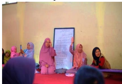
Gambar 1 Mahasiswa memandu anak-anak dalam sesi pengajian

Dalam pelaksanaan kegiatan pengajian bagi anak-anak, mahasiswa KKN Kelompok 1 menerapkan inovasi dalam metode pengajaran yang disesuaikan dengan usia dan kemampuan mereka. Pembelajaran dimulai dengan merancang kurikulum yang lebih terstruktur, mencakup hafalan doa-doa harian, tata cara wudhu, shalat, serta tajwid dan makhrajil huruf. Kurikulum ini bertujuan untuk memberikan pengetahuan agama yang mendasar namun penting bagi anak-anak, sehingga mereka dapat mempraktikkan ajaran agama dalam kehidupan sehari-hari.